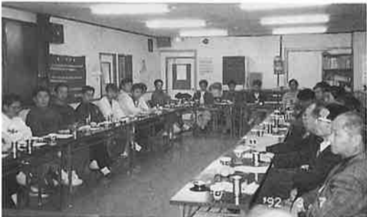
ディスカッション風景

茨城県商工会連合会通常総会(5月29日開催)において役員改選が行なわれ、千葉会長が、連合会理事に選出されました。