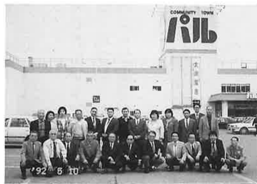
江釣子SC (パルの前にて)

平成4年度の役職員視察研修を去る5月10日、12日に実施しました。視察先は、岩手県江釣子SC並びに宮城県気仙沼流通センターですが、特に本年は阿見町において地元主導型SCCのオープンが予定されているだけに、同じ地元主導型SCCとして成功した代表例でもある江釣子SCには、早朝からの長旅にもかかわらず参加者全員関心をもち熱心に研修しました。