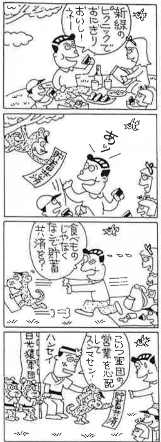
貯蓄共済は、貯蓄・融資・保険がセットされた商工会の制度です。