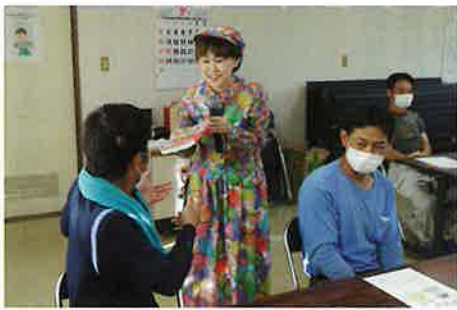
安全対策の基本ABC：当たり前のことをバカにしないで、ちゃんとやる。受講者参加型の楽しい講演会になりました。

よう」が披露されました。建設現場に限らず、私たちの日常でも、ちよつとした不注意が事故に繋がります。安全対策の基本ABCを一人一人が実践して、身近に潜む危険を回避できる安全な仕事環境を維持しましょう。