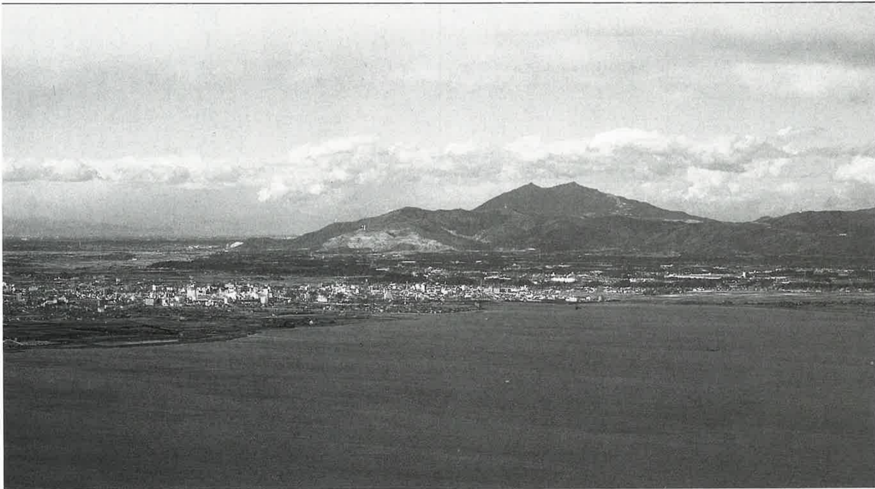
(筑波山 島津の上空より撮影)

発行所 阿見町商工会 阿見町大字阿見2083-2 TEL 0298-87-0552 FAX 0298-87-0342 発行責任者 千葉 力三 商工会員数 838名 青年部員数 46名 婦人部員数 110名