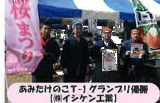
あみさくらのこーりーグランプリ優勝 (株式会社イシケン工業)

司会で進み、みならいモンスター(阿見観光大使)やキッズダンス、フラダンス、ねばねば音頭など各種踊り、青年部ビンゴ大会を盛り上げてくれました。またステージ以外でもミニトレイン、ウォークラリー等、会場の隅々まで仕掛けを用意。皆様に楽しんで頂けたのではないのでしょうか? さくらには3分咲きでしたが、大変好評のまま終了。来年以降もさらにパワーアップしてまつりを盛り上げられるよう青年部が知恵を出し合い頑張ります!