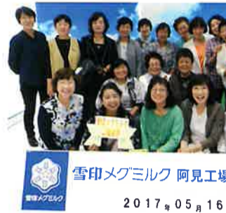
工場見学終了後の記念撮影

総会終了後には、視察研修として「雪印メグミルク阿見工場」へ見学に伺いました。阿見工場で製造されている製品について説明を聞いた後、見学のスタートです。見学の途中にはVR技術を用いた映像で実際に自分が製造ラインの横に立って見ているかのような体験に驚きました。