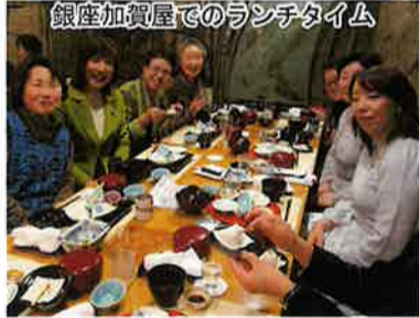
銀座加賀屋でのランチタイム 苦難の道のりをも癒してくれる美味しいご飯と、繊細で細やかな接客に部員も大満足。

なんと研修当日は東京マラソン開催日で、銀座中央通りは交通規制で完全に通行止め。目的地から少し離れた場所までバスを降車し、マラソンの大観衆の間をすり抜け、慣れない地下道で迷いながら昼食場所の「銀座加賀屋」へ。