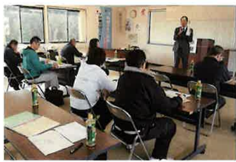
セミナーは1日目は夜、2日目は午前中の開催でしたが、熱意ある参加者達が集まりました。

セミナーでは、経営計画作成にあたっての基本的な考え方として、ビジネスチャンスや新しいニーズに繋がる「小さな変化」に気づくことの大切さ、知の追求、顧客視点、マーケティングの手順など経営計画の基礎を学びました。