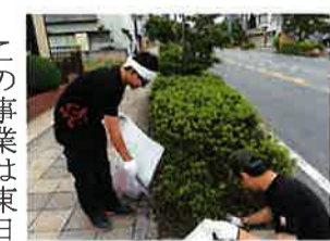
この事業は東日本大震災をはじめ、各地で発生した災害における復興支援活動等でも改めて確認された青年部及び地域における「絆」について確認・感謝することを目的として毎年行っています。青年部の定年が45歳となり初めての活動となったことあり、昨年よりも多い18名の参加協力を頂きました。小雨混じりの早朝、四グループに分かれて国道沿いの清掃活動を行いました。

4回目(目) さくらまつり中止 4回目のさくらまつりは、残念ながら雨天により中止となりました。開催に向けてご協力頂いた関係各位にはご迷惑をお掛けしてしまい、心よりお詫び申し上げます。早朝より雨と天気予報を見つめておりましたが、濡れて滑りやすいステージはケガを誘発しやすく、出演する子供たちの安全を第一に考慮すると中止決定は仕方なく、苦渋の決断となりました。しかし、今回の中止により浮き彫りになった反省点を活かし、今後の開催に向けて実行委員会の早期立上げを決定しました。2年分のパワーを充填した次回のさくらまつりにご期待下さい。