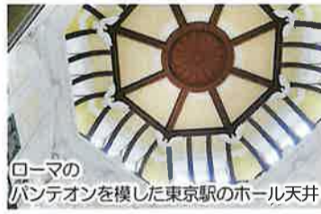
ローマのバンテオンを模した東京駅のホール天井

東京都大田区の「おた工業フェア」と改築された東京駅と「東京駅100年の記憶」を見学してきました。「おた工業フェア」は区域に蓄積されている工業技術等を紹介する高度技術・技能展で、公益財団法人大田区産業振興協会が開催している。大田区は都内最大の工場集積地であり、京浜工業地帯の「東京駅100年の記憶」を見学。日本近代の歴史とともに歩んできた東京駅の1世紀にわたる記憶を近代建築史や絵画、写真、文学などで当時の様子を振り返ることの有意義さを実感した。我々も未来を意識し、写真や映像の記録を後世に残すことを意識して行きたいと思う。