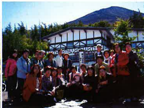
世界遺産となったばかりの富士山。天気が良くて本当によかった。