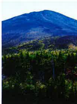
すぐそこに見えるのに実は遠い頂上。登りたい！

今年の女性部日帰り研修の行き先は、世界遺産に登録されたばかりの話題の「富士山」！ 富士山に行く。それだけでも何気に嬉しく、移動時間の長い車内も富士山効果で和気あいあい。5合目を目指して走るバスの車窓を眺め、参加者から口々に呟きが... 「ここにくるのはもう何年ぶりだろう...」 バスを降り、富士の独特の山肌を散策しました。山の天気は変わりやすいといいますが、当日は晴天！どこまでも澄みきった青い空にそびえ立つ富士山の威容には、やはり感動を覚えました。 さすが世界遺産登録されただけあり、売店も観光客で溢れていました。特にテレビでも紹介された「富士山メロンパン」は大人気で長蛇の列。見学時間ギリギリまで並んで手に入れました。 形はまさに富士山。メロンパンの中はたつぷりのクリーム。とてもいいお土産となりました。 帰路の途中で御殿場アウトレットに立ち寄り、思い思いの袋をさげてバスの中へ。空っぽだったバスのお土産で満杯となり、各参加者の目にも手にも、たくさんの思い出が満たされた研修となりました。