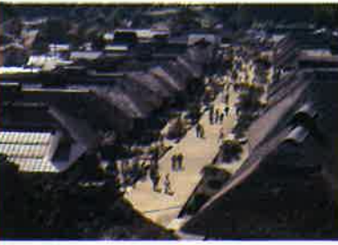
江戸時代の空気が漂う大内宿

毎年人気の恒例行事、従業員福利厚生事業。今年も60人以上の参加があり、バス2台を連ねて大内宿、塔のへつりなど、西会津の名所を巡りました。 この季節は木々の彩りが始まり、バスからの景色も絶景！車窓を流れる山の風景は眺めているだけで癒されます。 第一目的地「大内宿」。30件以上の茅葺屋根の古民家が立ち並ぶさまは、まるで江戸時代にタイムスリップしたかのよう。古民家の上がり込んで名物「ねぎそば」を楽しみ、有名撮影ポイントでの宿場の写真撮影。 第二目的地は「塔のへつり」。展望台から水に削られた景色を一望する人、吊り橋を渡って、水 にえぐられた岩肌からの眺望を楽しむ人。お店に座って美味しいものを思い思いの時間を過ごしました。帰路、甲子高原や那須「お菓子の城」に立ち寄ってのお土産選びも楽しみのひとつです。 甘いお菓子の香りでいっぱいのお店。かわいなお菓子の数々は甘党の心を揺さぶりますなあ。 毎年、日帰り旅行の為に開催範囲が限られてはしましますが、これからもこの事業を大事に行きたいと思えます。