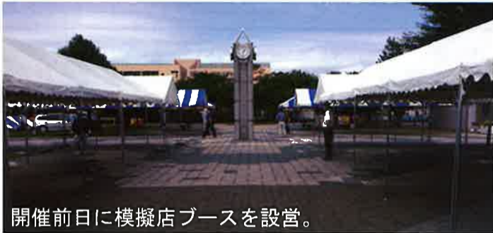
開催前日に模擬店ブースを設営。