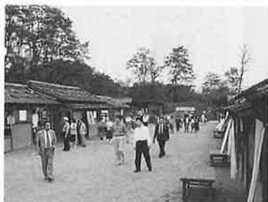
足利ロケセット風景

会員従業員親睦旅行は、太平記の里めぐり、六〇名の参加を得て、七月二十九日（日）実施。バス二台で商工会午前七時に出発。