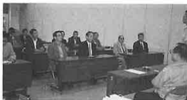
キヤノン福島工場内研修風景

企業連絡協議会の視察研修会が、二十五名の参加を得て、七月二・三日の両日にわたり行なわれた。一行は、商工会前を朝六時に出発し、藤原三代栄華を誇った平泉中尊寺方面に向った。