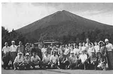
富士山をバックに記念写真

会員研修は、サロン・エクスプレス号による河口湖と富士スバルラインの旅。四〇名の参加を得て、七月二十四・五日に実施しました。JR土浦駅午前八時四十五分発。富士