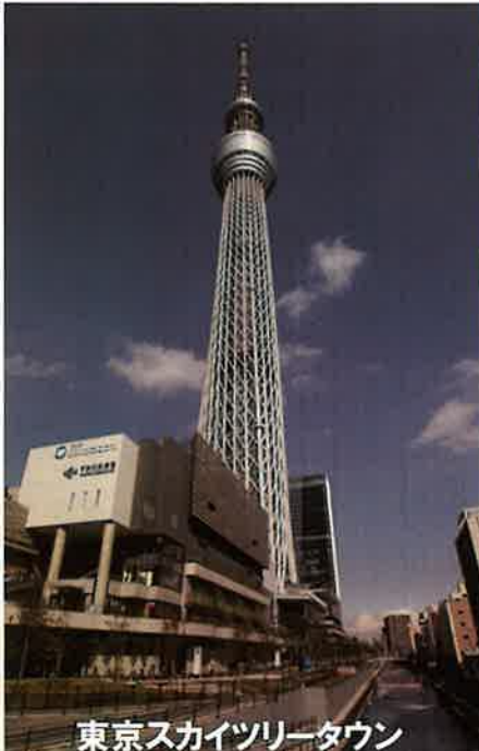
東京スカイツリータウン