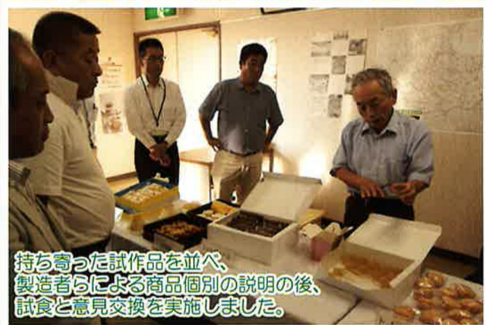
持ち寄った試作品を並べ、製造者らによる商品個別の説明の後、試食と意見交換を実施しました。