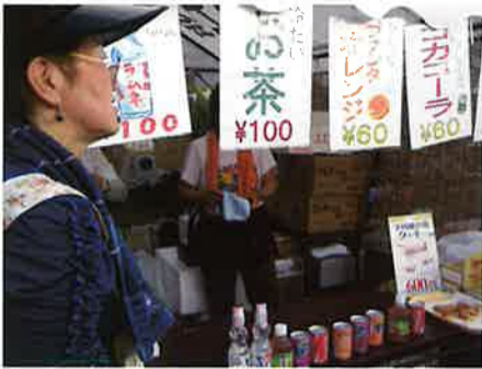
とても暑いので、冷たい飲み物も販売!

女性部 まい・あみ・まつりは、女性部にとって恒例行事。毎年、まつりが近くなると部員達がバザーの品物を持ち寄ってきます。その光景は商工会の風物詩のひとつにも思えます。会場ではタオルや石鹸、陶器やグラス、雑貨等を女性部もち前の掛け声で来場者の足を止めては、巧みな話術で商品を見事に売り捌いていきます。ちなみに、この売上は女性部の活動資金の一部となるのです!