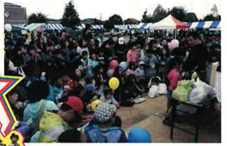
子供達に大人気!ピンゴゲームとAPカードこども抽選会

今年も、あみ商工まつり、さわやかフェア(町)創療祭(県立医療大)の三大イベントが同時開催!曇りのち雨という予報の中にもかかわらず、多数のお客様がご来場下さいました。心配された空模様は、午前中の演芸やソーラン、午後の芸能ショーまでは曇天を維持してくれましたが、お楽しみ抽選会中に雨模様となり、会場内に傘の花が咲き始めました。