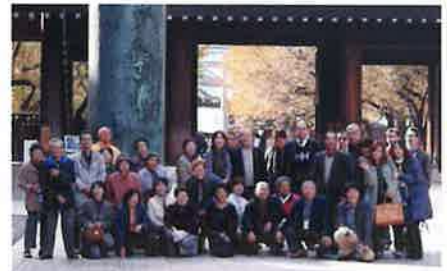
靖国神社にて。後ろの柱は明治20年に建てられた第二鳥居の一部で、青銅製の鳥居としては日本一の大きさを誇ります。

その日は茨城県民の日である上に、横浜でAPECが開催されているので、かなりの混雑を予想したが、予定通りに目的地の築地市場へ到着することができた。