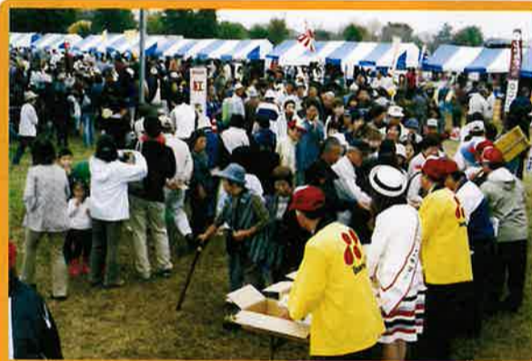
メインステージの両サイドはすごい人だかり。用意したクッキーはものの数分で完配。

また、その後の検討により、土産品のベイスとなるサブレの見直しが行なわれ、最終的にはクッキーによる開発に移行する事に決定し、「予科練の街クッキー」の試作・製作が行なわれた。できあがったクッキーの公開は「商工まつり」にて行なわれ、デザイン発表、デザイン採用者表彰を行なった後、来場者へクッキーの無料配布を実施し、町民に対し予科練の街クッキーの存在をPRする事が出来た。また、会員に意見を聞くため、全会員にクッキーとアンケートを送付。今後の参考となるご意見を多数頂くことができた。今後は、各関係機関と協議の上、包装紙デザインの決定、商品の紹介しおりの検討、商品販売の募集、まち歩きマップやポスター作成等へと進展する予定。