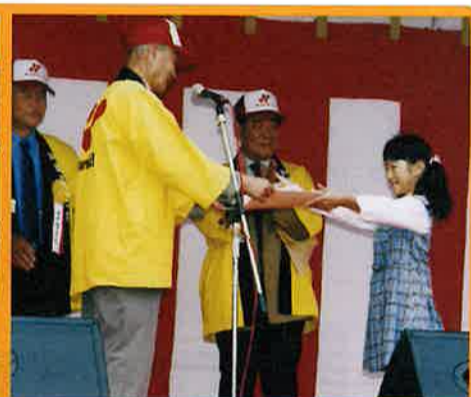
採択されたクッキーデザインの表彰。

次の見学地は「地球の丸く見える丘展望館」。天候状況が揃えば、鹿島灘から筑波山を望み、九十九里浜まで見渡す事が出来る!...なのですが、あいにくガスがかかっており、遠くまで見渡す事は出来ませんでした。犬吠崎では昼食・自由散策。水族館に向かわれた方や、お土産を物色する方、アイスクリームを楽しむ方、灯台に登った方、海岸を歩かれた方などのんびりした海辺の空気を満喫しました。その後、我々2台のバスは銚子の煎餅工場とお寺を時間差で見学(&買物)。最後には一番の買物ポイントである魚市場に立ち寄り、新鮮な魚介類を買ったわたりと、楽しい一日の締めくくりを過ごしておりました。来年はどうなることか?