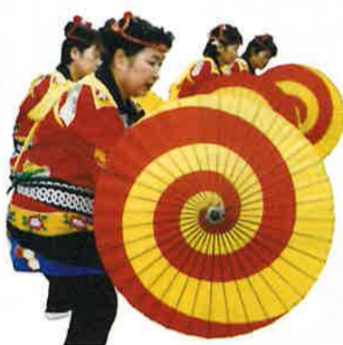
福田太鼓 実教源太踊り