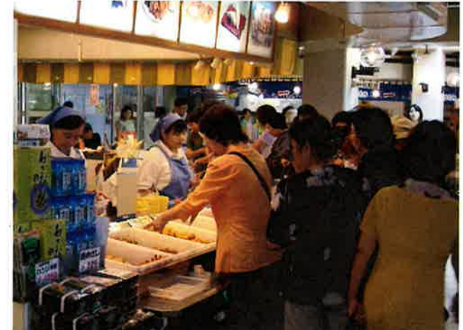
美味しそうに並んでいる美味しそうな海の幸と、威勢のいい掛け声についつい引き寄せられてしまいます・・・。