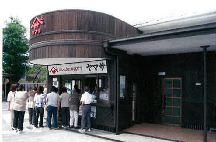
見た目にも面白い醤油の大樽を模したヤマサ醤油の売店。醤油映画を見た後だけに醤油の購買意欲に火が点きます。