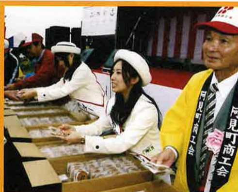
クッキーの無料配布では町のアンバサダーにもご協力いただきました。