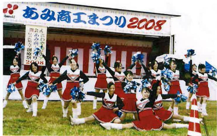
霞ヶ浦高校千アダンス