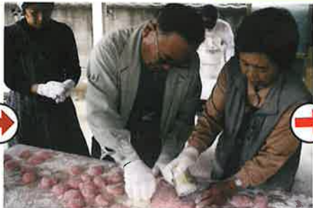
熱いつきたてモチを茶筒で切り分けます