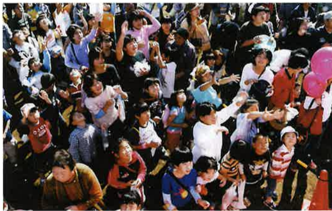
「紅白モチまき」モチもお客さんもたっくさん!