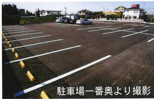
駐車場一番奥より撮影