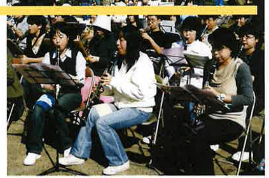
阿見吹奏楽団によるオープニング演奏