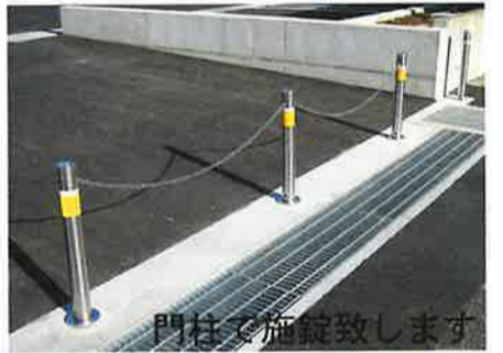
門柱を施錠致します