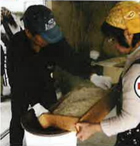
一度に四升の餅米をつきます

特賞(商工会長賞)大型カラーテレビをはじめ、DVDプレーヤー名湯ギフトセット、自転車、床用ワックス、除菌ウェットティッシュ電卓、石油ファンヒーター、カメラプリントゴッコ