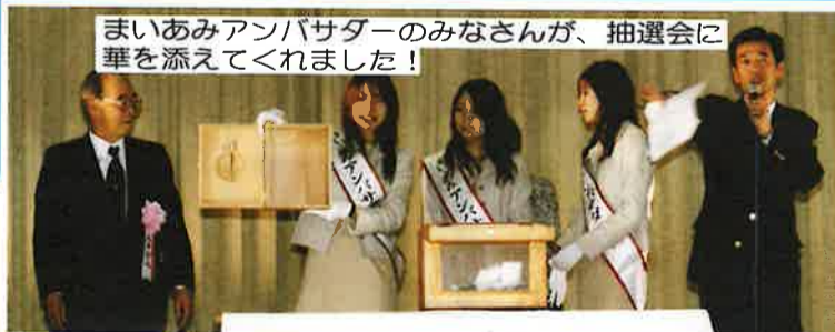
まいあみアンパサターのみなさんが、抽選会に華を添えてくれました!