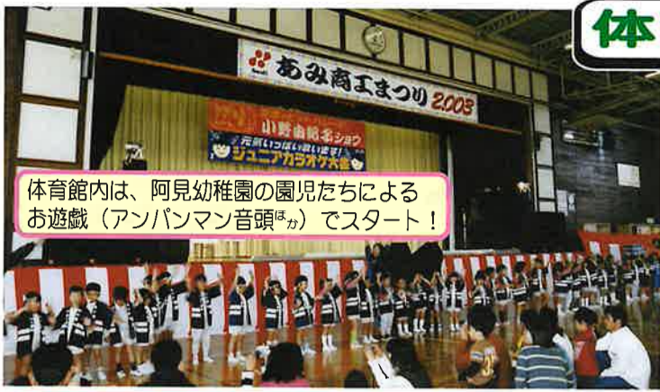
体育館内は、阿見幼稚園の園児たちによるお遊戯(アンパンマン音頭 ほか )でスタート!