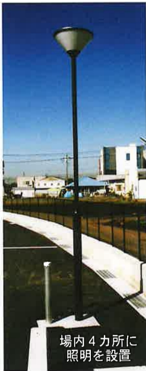
場内 4 カ所に照明を設置