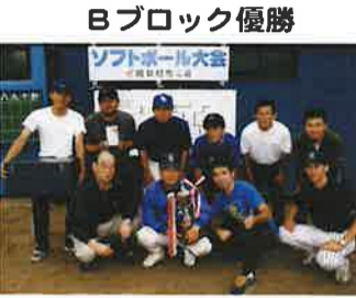
Bブロック優勝 茨城銀行荒川沖支店

今年の大会開催日は、早朝の小雨が少々気になりましたが、結局降ることもなく、曇り空の下で風もなく、スポーツをするにはベストなコンディションになりました。 強豪揃いのAブロック（計一〇二名／七チーム）と、エントリークラスのBブロック（計一六名／七チーム）が熱戦を繰り広げました。 試合中の各陣営からは、バッターやランナー、そして守備へ声援と激励が飛びます。体を動かすこと、大声を出すことは、ストレス発散に大いに役立つかと思えます。 Aブロック優勝は株式会社ツムラ、Bブロック優勝は株式会社茨城銀行荒川沖支店でした（金融機関の優勝は初めて！快挙です）。それにしても1日で何試合もこなした皆さんの夕方には脱帽です。