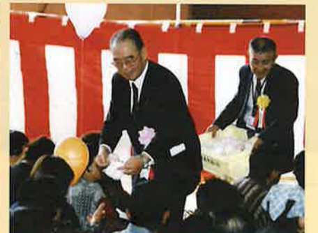
体育館内のお年寄り・身障者の方に ★紅白モチを配布★