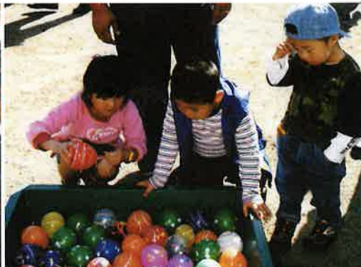
青年部：風船ヨーヨー