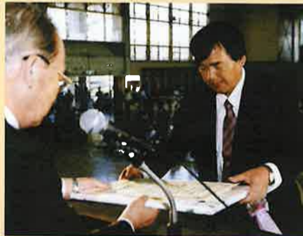
会員事業所 優良従業員表彰