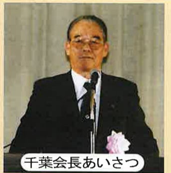
千葉会長あいさつ