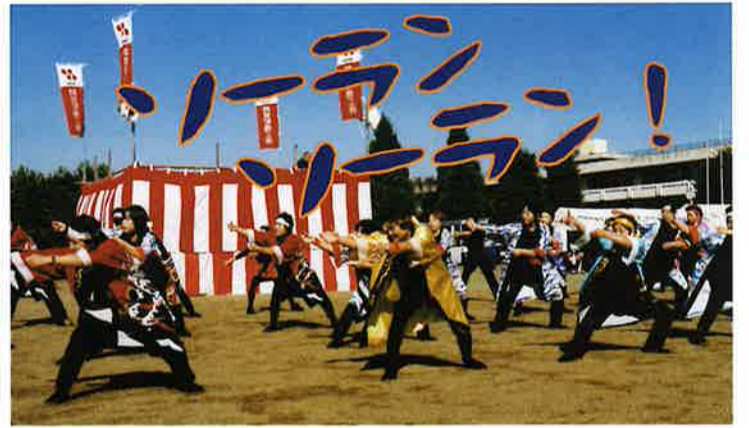
「はつらつソーラン会」のソーラン踊り