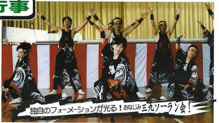
独自のフォーメーションが光る!おなじみ三九ソラン会!