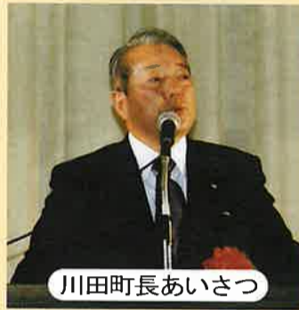
川田町長あいさつ