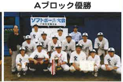
Aブロック優勝 ツムラ