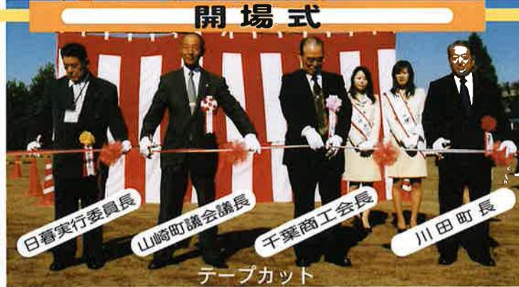
日暮実行委員長 山崎町議会議長 千葉商工会長 川田町長 テープカット