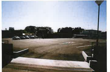
外側の出入り口（通常は施錠）