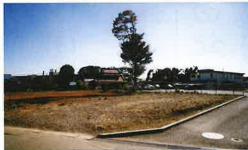
施工前の駐車場予定地