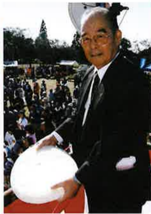
親モチは誰の手に?