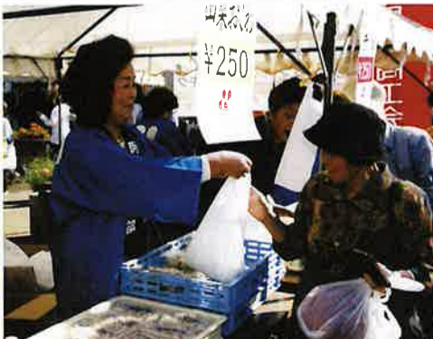
女性部：山菜おこわ販売