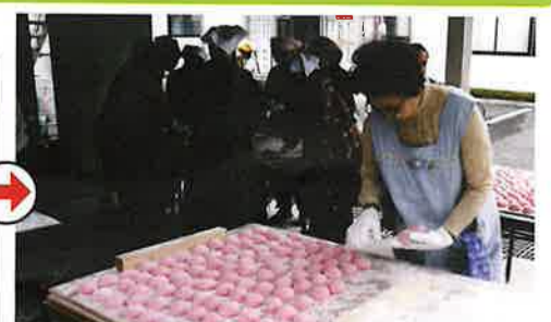
丸めたモチをきれいに並べて乾燥させて完成!

あみ商工まつりで大好評の「紅白もちまき」はあっ?という間に終わってしまいますが、一個一個の紅白もちには、多くの人手間と時間と愛情がたっぷり含まれております!