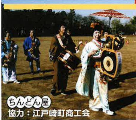
ちんどん屋 協力：江戸崎町商工会