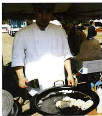
APカード・商業振興会 ヤーゴン餃子&あみごんサブリ 無料配布に長蛇の列!