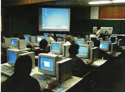
パソコンの基本的操作を学ぶ受講者たち

商工会事業の中でも人気の高いパソコン教室。ここ数年初級コースだけでなく、一歩進んだ中級コースも実施し更なるパソコン利用への関心が高まっており、パソコンを使うのは、普段の仕事用のソフトしか使えなかったり、テキストで数字しか叩いたことがないという方が結構いらつやいます。確かに仕事上ではそれで事足りるかもしれませんが、それだけでは、せっかく高い費用をかけて購入したパソコンの機能を十分に活用しているとは言えません。 パソコンの能力は私達が思っている以上に高度なものです。普段から使っていない「えっ、こんなこともできるの？」、「なんて便利なんだ」など新鮮な発見がたくさんあります。まず初心者レベルで「こんな事できたらいいの事なあ」と思えるたいの事