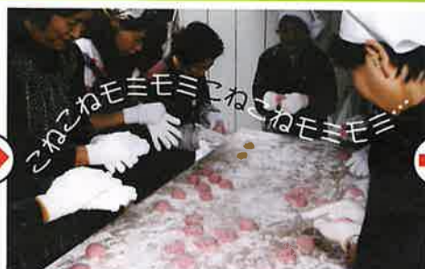
モチまるめは熱いうちに手際良く!