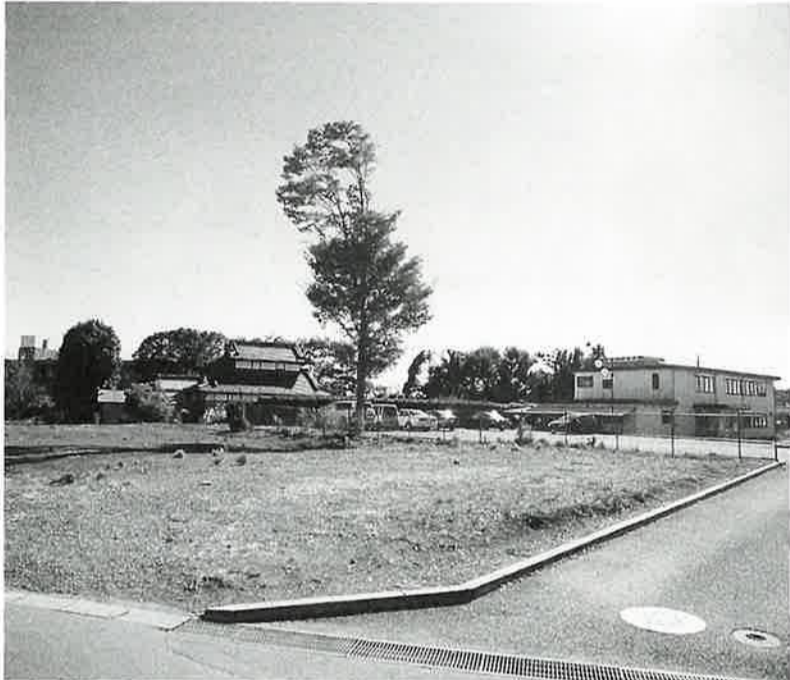
(写真上:下図)これからの活用が期待される購入地