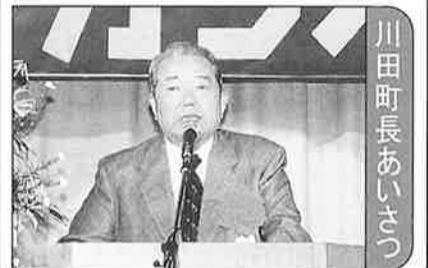
川田町長あいさつ