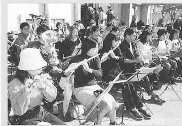
阿見吹奏楽団の演奏