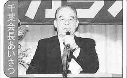
千葉会長あいさつ