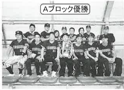
Aブロック優勝 吉野工業所