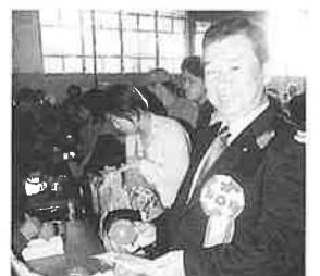
福岡校長先生も 幸運のボールを ひろえてニッコリ。