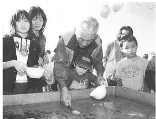
金魚すくいも大人も子供も大好きです