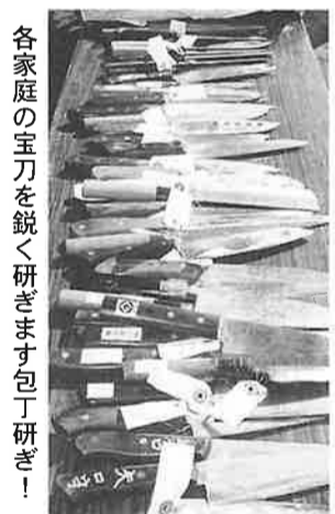
各家庭の宝刀を鋭く研ぎます包丁研ぎ!