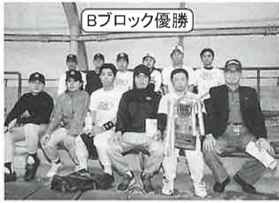
Bブロック優勝 理想科学工業(株)霞ヶ浦工場