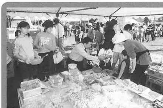
阿見町商業振興会