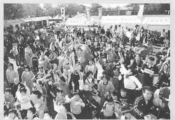
スゴイ人だかり!恒例の紅白もちまき