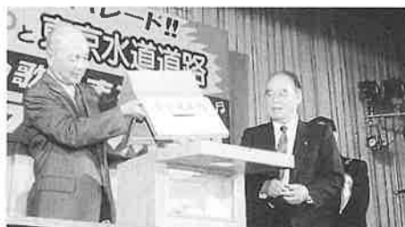
恒例のお楽しみ抽選会! 今年は当選確率が高かったです

いかがでしたか?今年の商工まつりは新しい企画が盛り山でした。足を運んでいただいたお客さんの満足度は、これまで開催されてきた商工まつりの中でも一番だったのではないのでしょうか? 屋外も屋内も、知恵を絞った実行委員の皆さんや、模擬店の皆さんのおかげで、新しいイベントがたくさん行われました。来年も新たなイベントを実施できるよう、アイデアをあたためておいて下さいね!実行委員の皆さん!