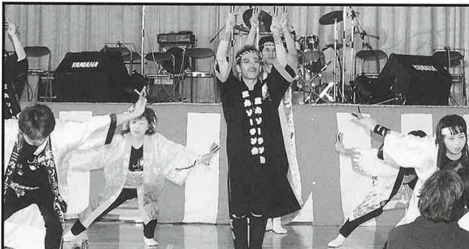
よさこいソーラン踊り (三九ソーラン会)

発行所 阿見町商工会 阿見町岡崎3-17-9 TEL0298-87-0552 FAX0298-87-0342 発行責任者 千葉力三 商工会員数 938名 青年部員数 40名 女性部員数 91名