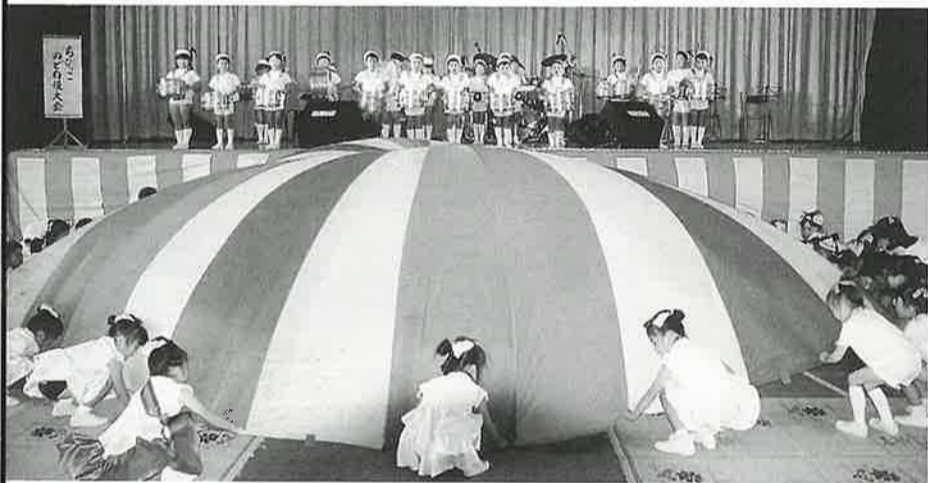
みどり幼稚園「園児鼓笛隊」