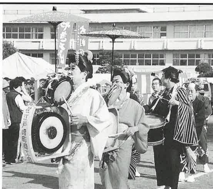
江戸崎町商工会がチンドン屋で応援!