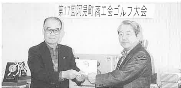
社会福祉協議会へチャリティ贈呈

10月16日火曜日、おだやかな天候の下、第17回商工会親睦ゴルフ大会が行われました。(阿見ゴルフ倶楽部)