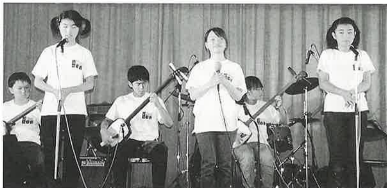
ちびっこ津軽三味線