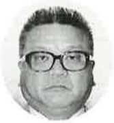
林 弘行 山口工務店