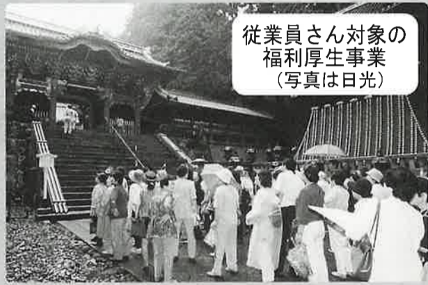
従業員さん対象の 福利厚生事業 (写真は日光)