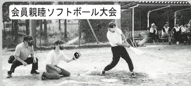
会員親睦ソフトボール大会