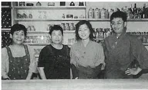
ぜひ一度おいでください。きっと御満足しますヨ。

『大八』とは「大人8人分の仕事の代わりをする大八車」から取られたものでしょうか、大人8人分の技術・気配りをもって、店に訪れるお客さんをもてなす「心構え」ということなのかもしれませんね。