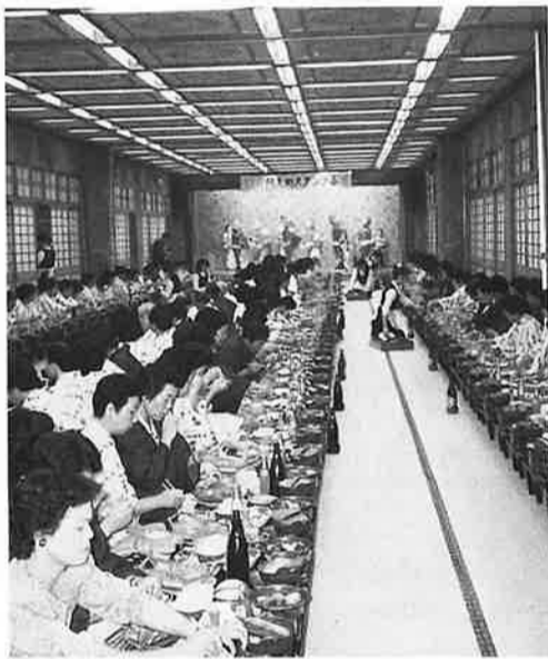
▲スタンプ事業の一コマ

スタンプ会のことにつきまして という状況であります。こうした て会員の皆様にお知らせ致しま す。御承知のとおり、私達の郷 るに極めて厳しい中にあります。