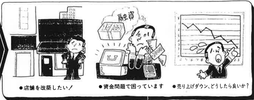
●店舗を改装したい！ ●資金問題で困っています ●売上げダウン、どうしたら良いか？