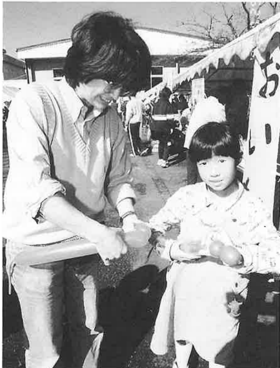
風船細工は難しいね