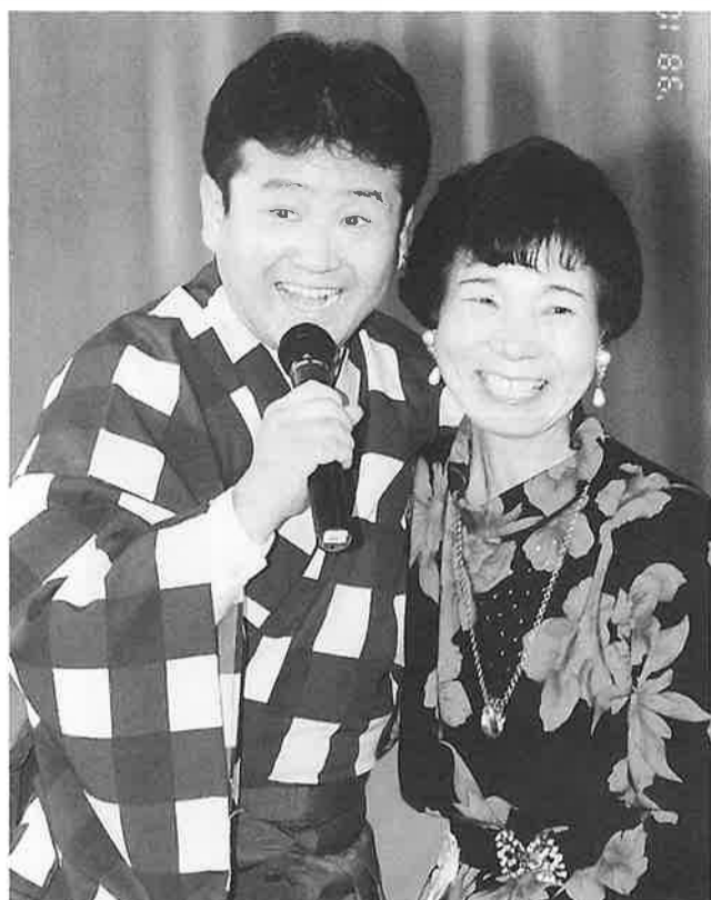
平成版『北國の春』背味孝太郎シヨ