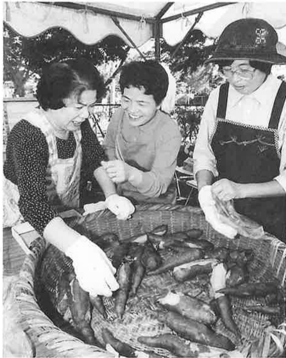
ホッカホッカのおイモだよ～