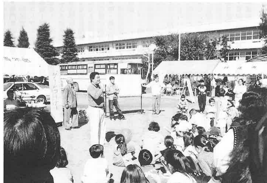
青年部のビンゴゲームは親子連れが大集合