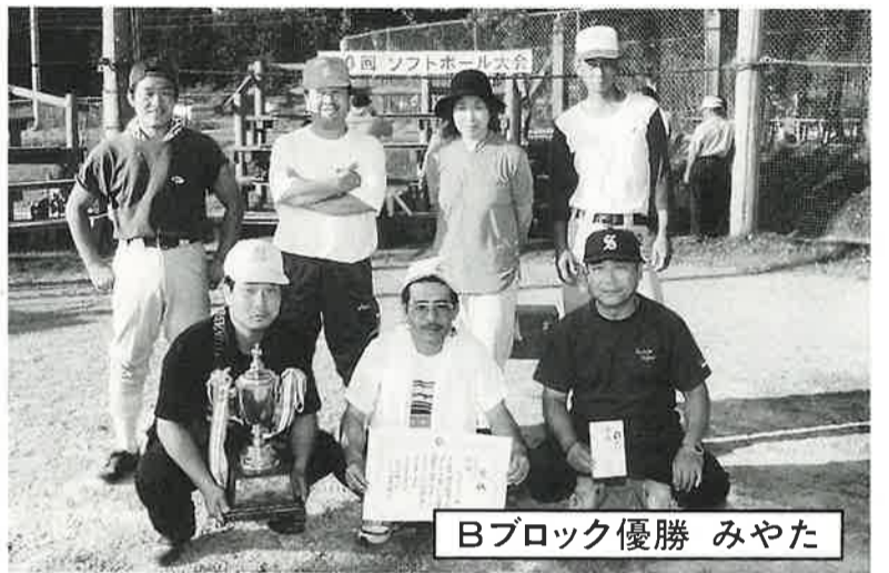
Bブロック優勝 みやた