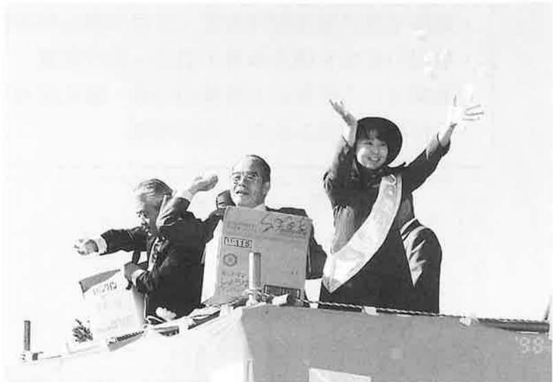
恒例の紅白もちまき。いくつひろえた?