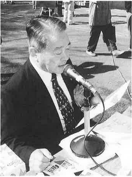
川田町長も朗読体験