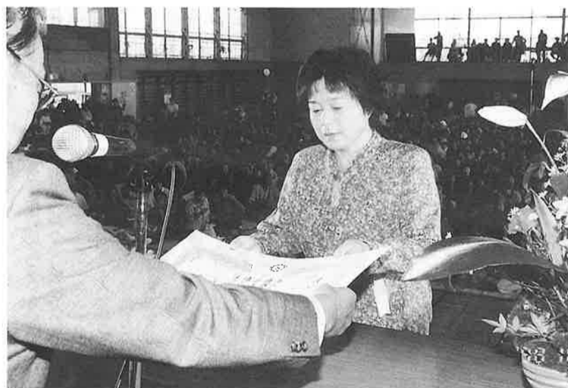
式典・従業員表彰