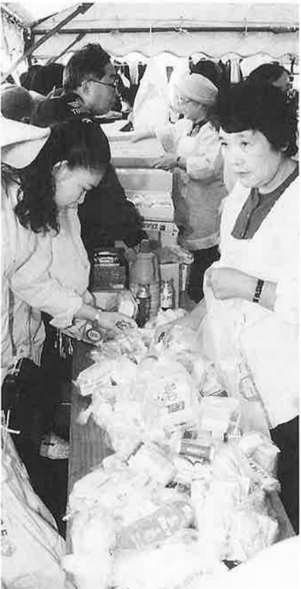
福祉バザーは大賑い