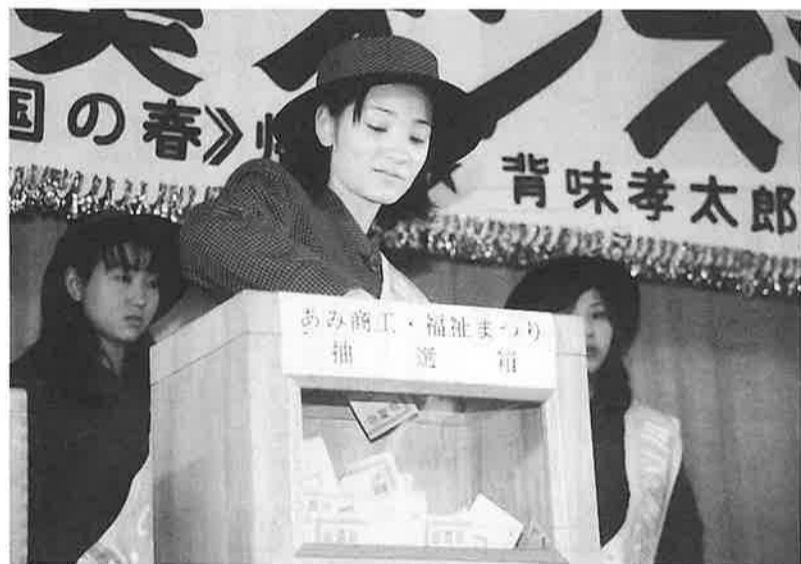
恒例お楽しみ抽選会