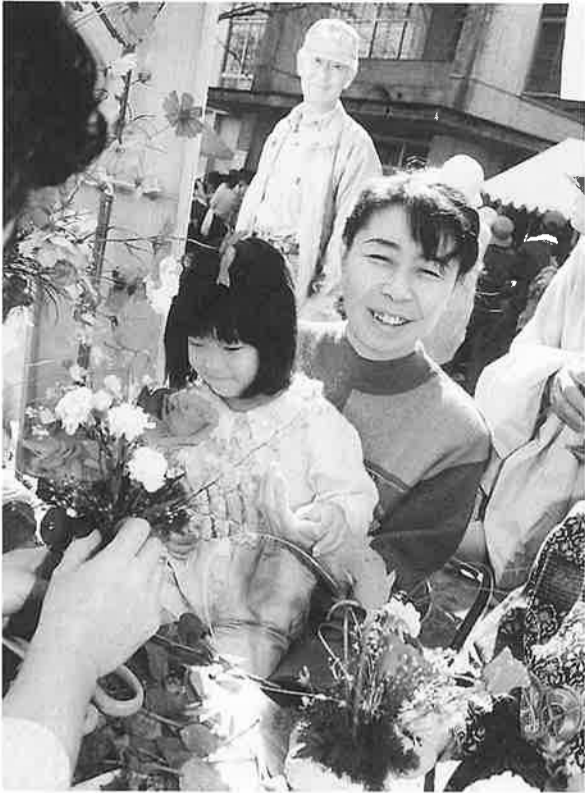
生け花って楽しい!