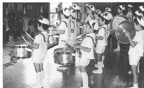
幼稚園児のかわいい鼓笛隊