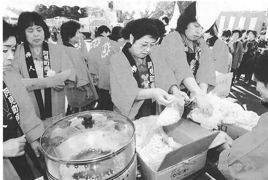
婦人部のポップコーンは大人気