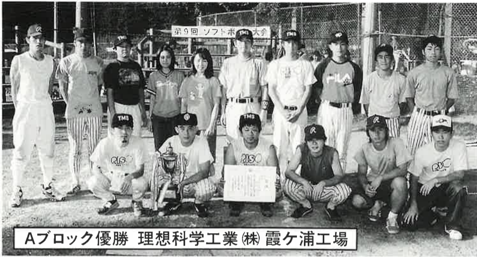
Aブロック優勝 理想科学工業(株) 霞ヶ浦工場