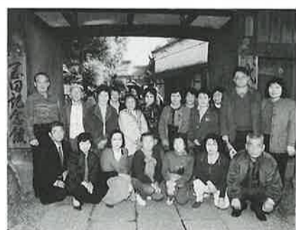
岡田記念館前にて

11月12日、80名の事業所従業員、家族従業員を対象とした福利厚生対策事業は、晩秋の蔵の街、栃木市と出流山満願寺を訪ねました。栃木市街では、旧家の蔵屋敷や、五年ごとの大祭に使われる見事な山車などを見学し、満願寺の参拝前に名物の手打ちそばに舌づつみをうち、奥の院まで足を運んだ人もいました。来年も多数のご参加をお待ちしています。