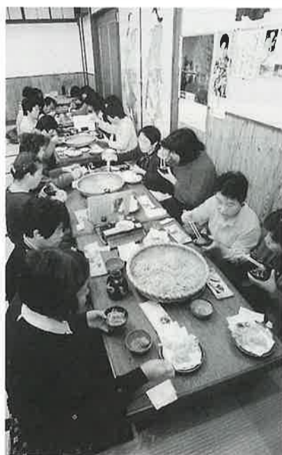
名物の手打ちそば