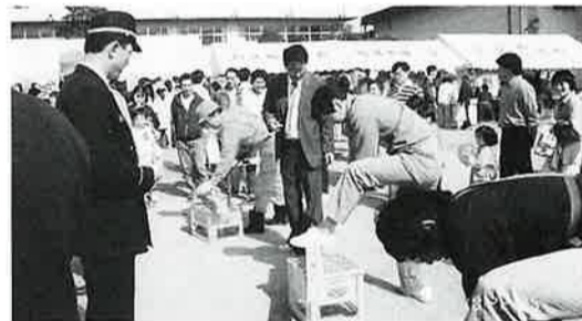
親子ゲーム、お父さんがんばって