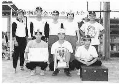
Bブロック優勝 川島ガス