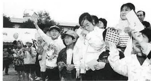
青年部によるビンゴゲームは大盛況