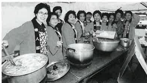
婦人部のけんちん汁は絶品!