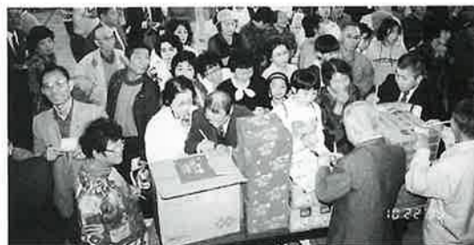
抽選引き替え風景