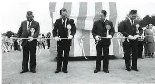
(左から)飯塚実行委員長、千葉会長、川田町長、徳永議長によるテープカット