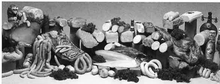
一流ホテル・レストランのシェフから高い評価を受けています。

シュローテーションによる品質管理のもと新鮮な製品を作り、又、最良の原料はもとより製造する人の心、すなわち『真心の味』をモットーにしております。 これを機に当社の高級手作りハム、ソーセージをぜひ一度ご賞味下さい。