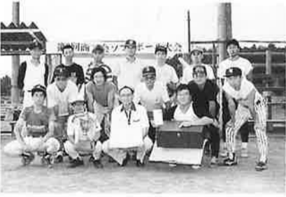
Aブロック優勝 ツムラ・A

九月十日(日)、商工会近辺では早朝から雨がポツポツと降り、大会開催が心配されたが、球場近辺では雨の様子もなく、グラウンドはベストコンディションで選手たちを迎えた。