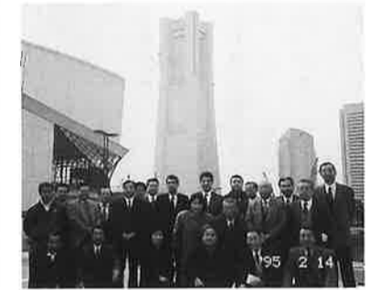
ランドマークタワー前にて

土木建設業部会では、商業まちづくり委員会と合同で視察研修会を実施し、25名の参加があった。今後のよりよい「町づくり」の為に理解が深まったものと思われる。