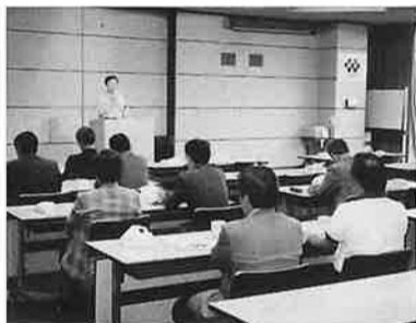
協和発酵工場にて

工業部会は、町内優良企業の協和発酵工業(株)土浦工場を9月27日、視察研修を行なった。その後懇談会で相互の親睦を図った。さらに、9月20日には講演会「中国ビジネスの必要性と危険性」の開催。サービス業部会との共催で3月23日、講習会「安全衛生と職場環境」講師