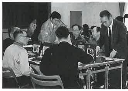
手作り年賀状講座