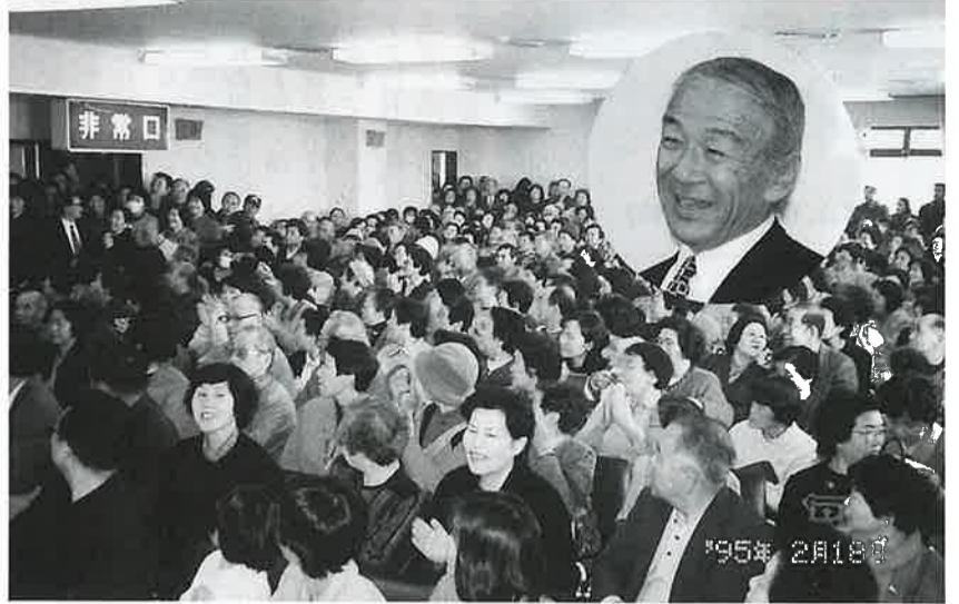
立錐の余地のない柳生 博講演会