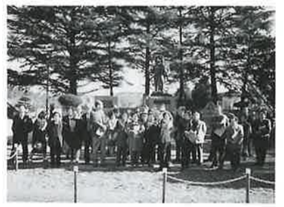
雄翔園「予科練の碑」の前にて