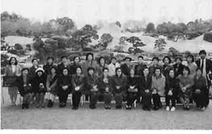
二十七名で記念撮影

婦人部設立二十五周年を記念して、二泊三日の日程で二十七名が、西九州を研修致しました。町おこしで全国的に有名なハウステンボス等非常に有意義な研修でした。本年は、五月十二日総会終了後、講演会を実施致しました。講師にサトウワカバ先生をむかえ、「女性に好かれりゃお店は繁昌」と題し、経営者、消費者の立場から、有意義な講