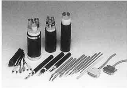
製品(電線被覆材料)

粉末状の塩化ビニルに副資材を加えて、成型加工に適するペレット(粒状)にしたものが、塩化ビニル・コンパウンド(ポリビニルコンパウンド)です。それぞれの用途に応じて、塩化ビニルと安定剤、可塑剤、充填剤、着色剤などの配合処方方を工夫しています。プラス・テックは社員間ばかりでなく、顧客とのコミュニケーションを図ることは不可欠