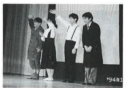
児童劇に出演の皆さん