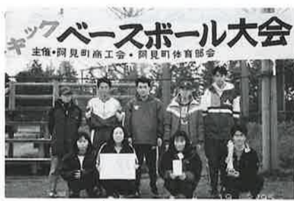
優勝(理想科学チーム)