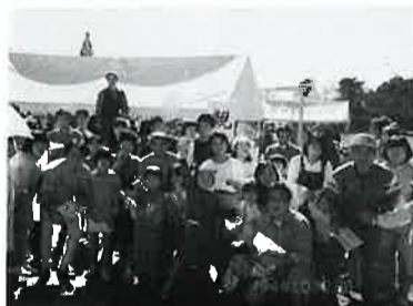
親子ゲームスタート