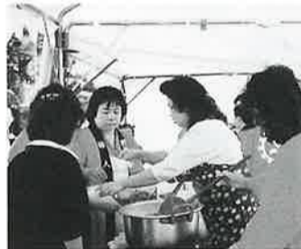
婦人部トン汁コーナー