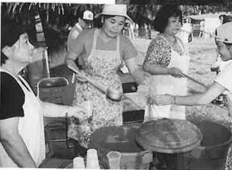
炎天下での麦茶サービス(婦人部)