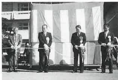
来賓役員揃ってテープカット