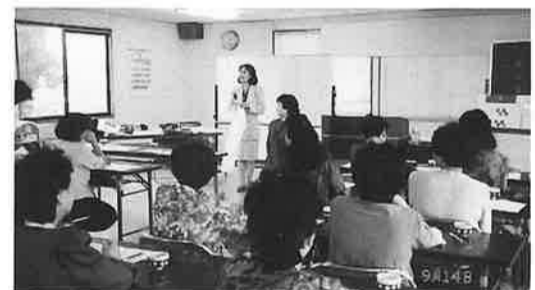
熱心に受講する婦人部員

会、商業部役員さんによる経営者懇談会を開催致しました。経営者からは、現在直面している問題点、今後の抱負、消費者からは、今後町へ・商店への要望等、活発な意見があり、二月の報告会にむけて、コンサルタント、県経営助成課、町役場の助言のもとに、今後の町形成のあり方を協議致しました。 各種調査、会議に御協力をいただき、ありがとうございます。