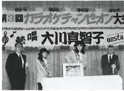
ミスまいあみによる抽選

お楽しみ抽選会 区長さんを通して、各家庭におくばりした案内チラシについている抽選引換券は、来