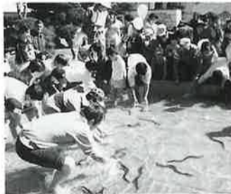
うなぎつかみどり