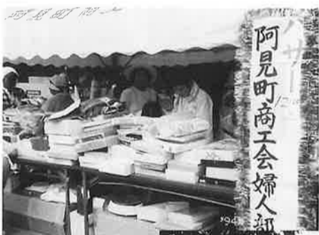
バザー(婦人部) 部員からの品々は好評のうちに売り切れ。