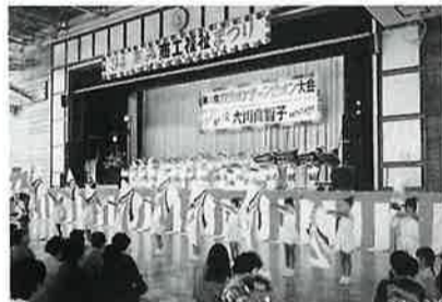
こども元気いっぱい「みどり幼稚園児」