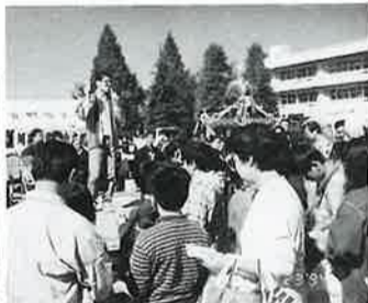
いつも大盛況の青年部のゲーム