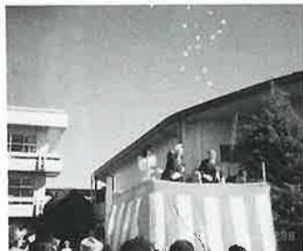
恒例紅白もちまき