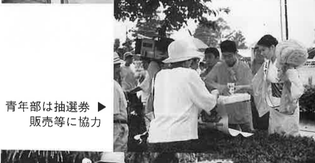
青年部は抽選券販売等に協力