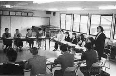
消費者との懇談会

去る九月一日(木)・四日(日)の二日間、町内七ヶ所で午前八時から午後八時まで、通行量調査を実施致しました。 車、バイク、徒歩と十年前の調査時と大きく変わった交通量に協力いただいた理事さん、青年部、婦人部の役員さんからは、驚きの声がありました。 又、十月二十四日(月)・二十五日(火)に、青年部による若年経営者懇談会、町内の事業所従業員、主婦による消費者懇談