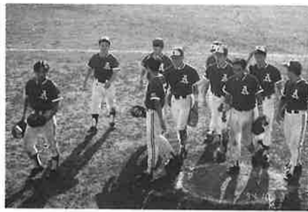
この回に決めるぞ!

一回戦 対大宮町8-6 打撃戦となり逆転勝 二回戦 対大洗町2-1 投手戦で逃げ切り勝 決勝戦 対神栖町2-1