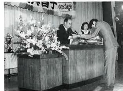
千葉会長より表彰をうける受賞者