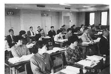
銚子青色申告会研修

で3月にはその成果が期待されます。 又、10月13日には、会員40名の参加をいただき、会員増強で優秀な銚子青色申告会を視察し、昼には銚子ならではの生きの良い魚を頬張りながら会員の交流をはかり大盛況のうち充実した日帰り研修を終りました。今後とも役に立つ青申告会を目ざし役員一同活動してまいりますので、各行事に進んで参加下さるようお願いいたします。