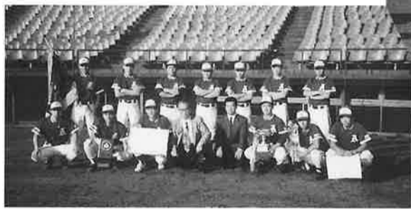
県青年部長、商工会長を囲んで

した。ありがとうございました。今後も、野球大会を始め、各事業も積極的に取りくみます。青年部は、四十才以下の事業後継者と青年経営者の集まりです。会員皆様の加入推薦をお願いします。