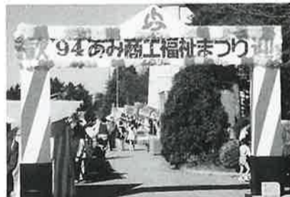
新しくなった入場アーチ