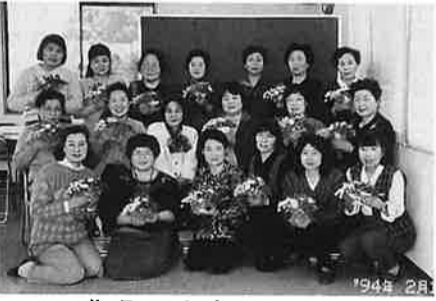
作品の出来に満足

た。 マイラブアミショッピングセンターを出発する時は雪が激しく降っており、目的地到着に何時間かかるのかと心配しましたが、何事も無く順調に行く事が出来ました。 「パセオ470」は福島県内でも初の本格的ショッピングモールで、三商店街一〇〇店舗で構成されています。歩車道を上手に組合わせ、いかに便利に快適にショッピングを楽しんでもらうかという点に工夫を凝らしている様です。 将来阿見町に商店街が形成される時は、人と車の問題は重要なので、参考になると思われました。