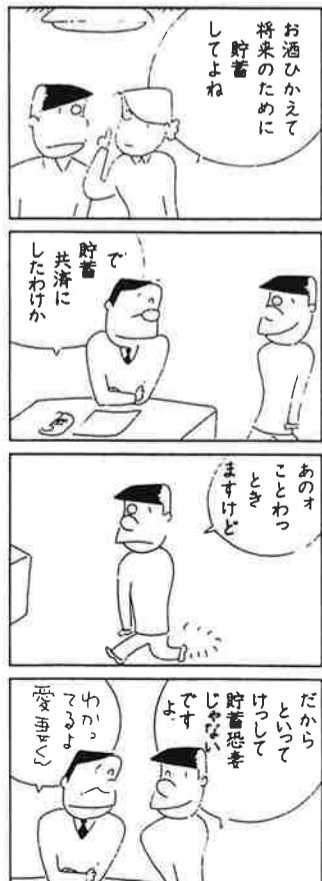
貯蓄共済は、貯蓄・融資・保険がセットされた商工会の制度です。