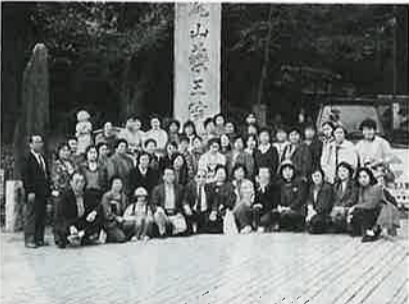
高尾山にて(二号車)

予め配付されたマップを手に、真言宗智山派大本山「薬王院」にまっしぐら。杉の古木の林の中、108段もある急な石段は青息吐息、いや、日頃運動不足の我々には良かったと言ふべきか。高尾山は野草・野鳥の宝庫と言われているが、残念ながら時間が足りず。山麓で食べたトロロそばの味は又格別。昼食を取っ