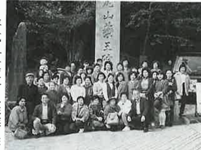
高尾山にて(一号車)

平成五年度会員従業員研修は、11月6日(土)に実施。研修先は、高尾山、深大寺・神代植物公園、80名の参加者は、バス2台に分乗し、商工会前午前7時出発した。道路は左程混雑はなく、バスは予定通り高尾山に11時に着く。清滝駅前で、全員記念写真を撮った後、135名乗りのケーブルカーに乗り、5分で標高600mの頂上に着く。急傾斜の路面には、参加者もビククリ。 予め配付されたマップを手に、真言宗智山派大本山「薬王院」にまっしぐら。杉の古木の林の中、108段もある急な石段は青息吐息、いや、日頃運動不足の我々には良かったと言ふべきか。高尾山は野草・野鳥の宝庫と言われているが、残念ながら時間が足りず。山麓で食べたトロロそばの味は又格別。昼食を取っ