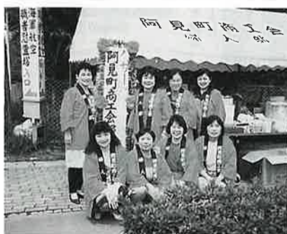
バザー 売上金を社会福祉協議会へ寄付