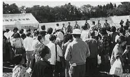
子供も大人も熱中、青年部のゲーム