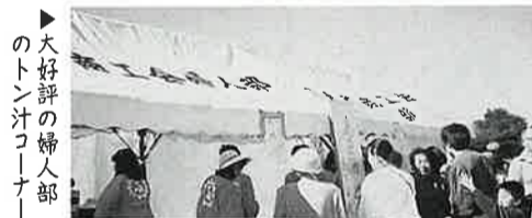
大好評の婦人部のトン汁コーナー