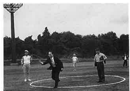
ソフトボール始球式風景