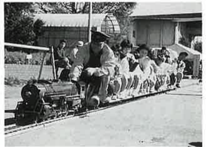
チビッ子に人気バツグン "ミニSL"