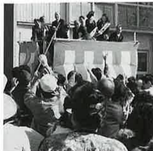
恒例 紅白もちまき