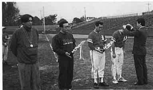
細谷県青連会長により表彰をうける

当商工会青年部は、二年連続商工会青年部県大会出場をめざし、当初より優勝の他、目的は無く、県南大会二連勝を目標に選手も気合十分、試合にのぞみました。 二回戦 対美浦村 9-0 準決勝 対江戸崎町 4-1 決勝 対河内村 11-0 あぶなげない試合はこびで優勝をはたしました。 この結果、10月13-14日の県大会に出場しました。