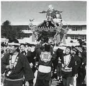
まつりの華 "神輿連"