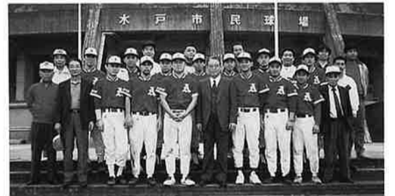
水戸市民球場前にて応援者と共に

一回戦 対神栖町 4-2 延長特別ルールで辛勝し、準決勝 対高萩市 0-2 今大会優勝の高萩市に惜敗し、三位となりました。 今後も、野球大会にも、積極的に取りくみます。 青年部は、事業後継者と青年経営者の集まりです。会員皆様の加入推薦をお願いします。