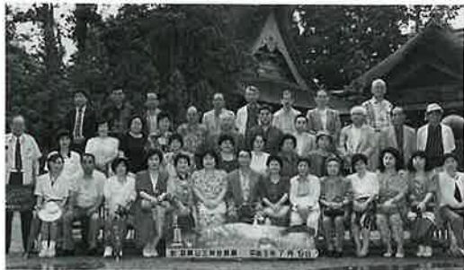
出羽三山と最上川舟下り

会員研修は、七月十八日泊二日で、山形路出羽三山最上川舟下りの旅を実施した。小雨模様だったが、参加会員三十五名六時定刻出発。常磐道いわき中央から長沢峠を経て、本宮ICから東北道村田JCTから山形道寒河北で昼食。 湯殿山の輝石安山岩から出る温泉で足を清めて、無病息災を祈る。鶴岡善宝寺で小雨の中、急ぎ記念撮影。魚類供養の為に建てられた五重の塔が美しく雨にけぶっていた。充お宿湯の浜温泉に到着。充