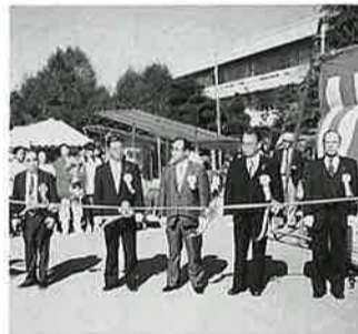
来賓役員揃ってテープカット