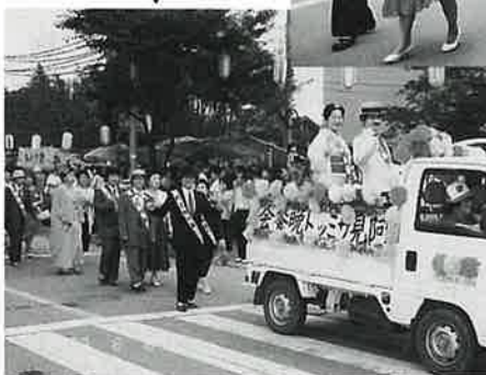
実行委員として、 企画より参加した 青年部、婦人部役員の 皆様ご苦労さまでした