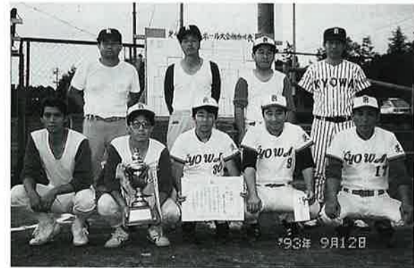
▲(優勝)協和発酵チーム

★優勝 協和発酵工業(株) ★準優勝 大塚・清和 商工会親睦ソフトボール大会は、第4回を迎え、20チーム(約三〇〇名)の参加があり、商工会にとっても、大きな、イベントになりました。 今年も、若栗球場において、8時より開会式を行ない、本図実行委員長の開会宣言、千葉商工会長挨拶、海野審判長注意、前年度優勝チーム(協和発酵工業(株))代表の選手宣誓の後、組合せ抽選を行いました。