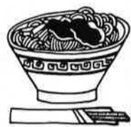
定休日 毎週水曜日