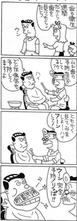
貯蓄共済は、貯蓄・融資・保険がセットされた商工会の制度です。