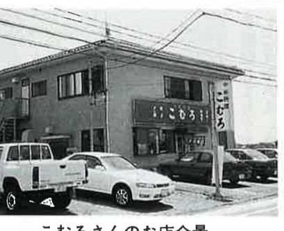
こむろさんのお店全景

Q-創業はいつですか？ 昭和42年に、中郷西(現中央三丁目)で開業しました。高校卒業して会社勤めの後、脱サラして東京で修業し、開店しました。